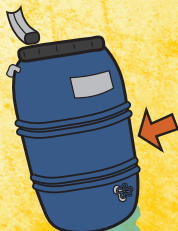
Barriles de lluvia*

*Para el agua que es difícil de eliminar, use un larvicida bacteriano como Mosquito Dunks cada mes, o cubra aberturas con mosquiteros.