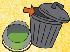
Contenedores y cubetas

Las larvas de Aedes pueden sobrevivir en cantidades muy pequeñas de agua - incluso 1/4" es demasiado: ¡Eliminalas!