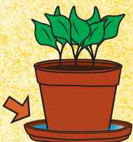
Platillo de planta en maceta