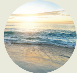
المساعدة في الحفاظ على نظافة مجاري المياه