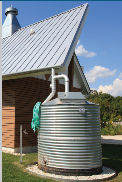
سیستم شکل 1

راهکارهای برتر مدیریتی (BMP) به تمیز نگه داشتن آبراه‌های ما کمک می‌کند راهکارهای برتر مدیریتی شما (BMP) طوری طراحی شده است تا مواد آلاینده از رواناب سیلابی را که از ملک شما نشئت می‌گیرد تا حداکثر امکان رفع کند. به عنوان مالک یکی از این املاک، به‌موجب مقررات کانتی موظف هستید بازرسی‌ها و امور نگهداری روتین انجام دهید تا مطمئن شوید که راهکارهای برتر مدیریتی (BMP) شما به‌طور مؤثر عمل می‌کند.