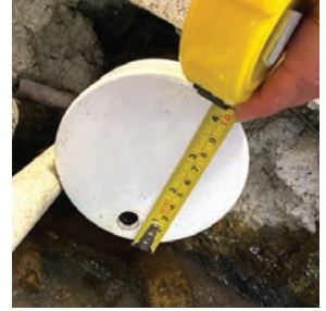
經測量的孔口尺寸