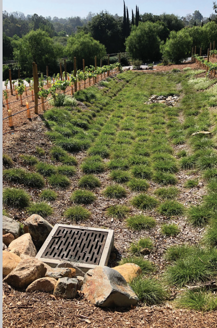
با پوشش گیاهی (BMP) راهکارهای برتر مدیریتی