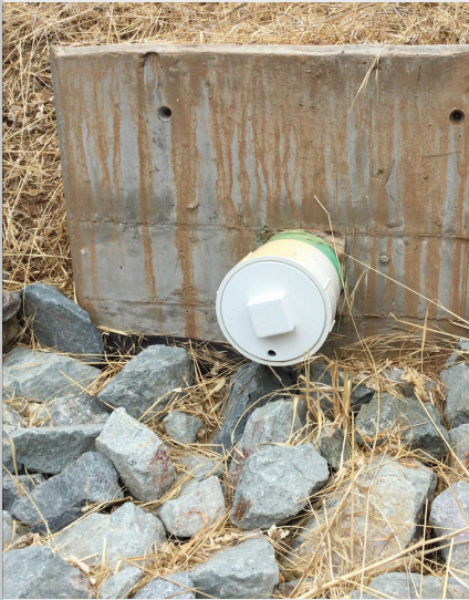
درپوش زهکش زیر با دهانه

به وبسایت روبرو مراجعه کنید: www.sandiegocounty.gov/stormwater