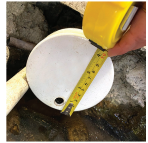
اندازه دهانه در حال اندازه گیری

دهانه با جریان کم، واقع در درپوش زهکش زیر اجازه می دهد که سیلاب با سرعت کنترل شده رهاسازی شود و فرسایش خاک پایین دست جریان را کاهش دهد.