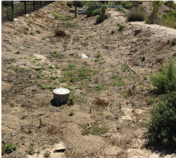
النباتات الصديقة لولاية كاليفورنيا