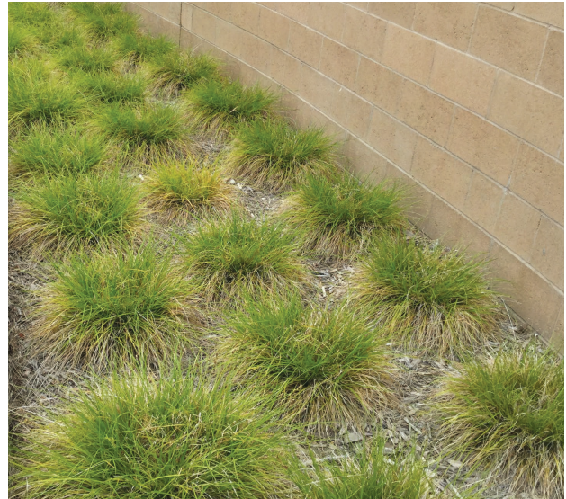
غطاء نباتي في حالة صحية سيئة