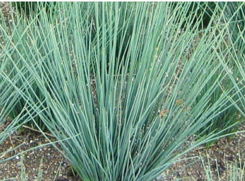
California Grey Rush (سازو خاکستری کالیفرنیا)