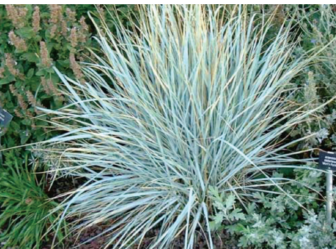
چاودار وحشی شاهزاده دره