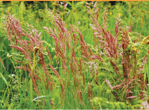
Red Fescue (علف بره قرمز)