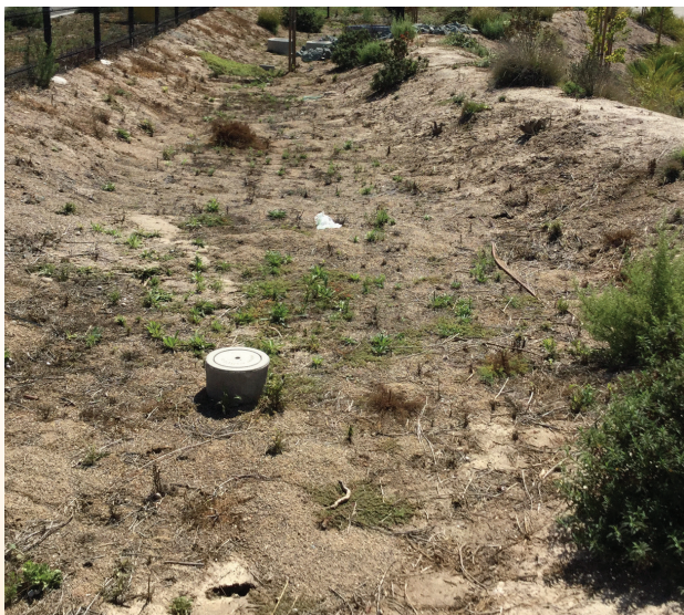
پوشش گیاهی در وضعیت سلامت نامناسب