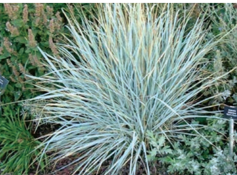
Canyon Prince Wild Rye