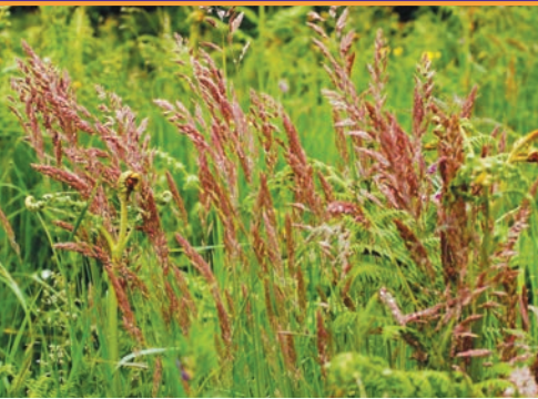
Cỏ Fescue Đỏ