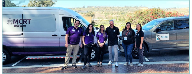
Những Nơi Cung Cấp Nhóm Di Động Ứng Phó Khủng Hoảng của Quận

Có trên toàn quận và cho mọi độ tuổi, MCRT thay thế ứng phó của cơ quan công quyền bằng các nhóm bao gồm chuyên gia sức khỏe hành vi được huấn luyện để ứng phó với những khủng hoảng trong cộng đồng và xoa dịu vấn đề liên quan đến rượu, ma túy, hoặc tình trạng sức khỏe tâm thần.