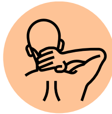
Rigidez de Nuca