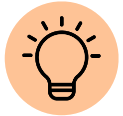
Sensibilidad a la Luz