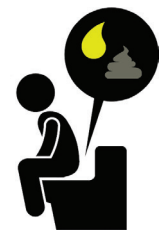
小便黃赤、糞便灰白，以及腹瀉

如果您有這些症狀，從而認為自己感染 A 型肝炎，請向您的醫師求診，或前往距離您最近的急診室就診。在上廁所之後和準備食物之前，務必使用肥皂和水洗手。